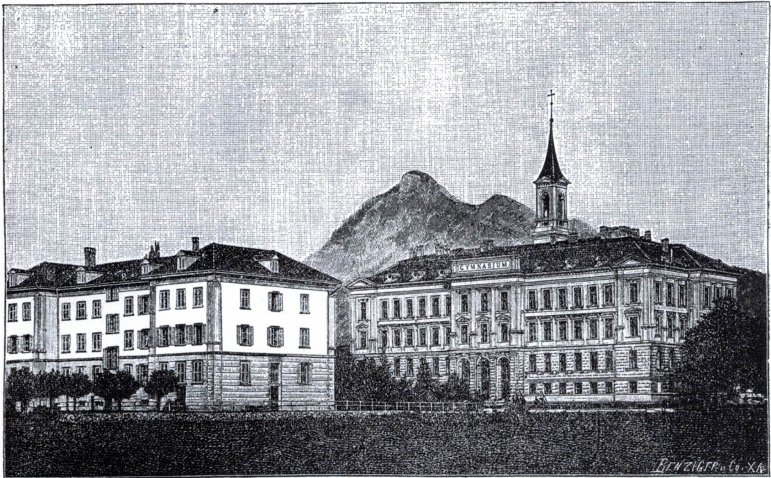
— Konvikt und Gymnasium. —